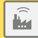
ГУДКИ ПРЕДПРИЯТИЙ И ТРАНСПОРТНЫХ СРЕДСТВ