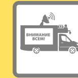
ПОДВИЖНЫЕ ЗВУКОУСИЛИТЕЛЬНЫЕ УСТАНОВКИ